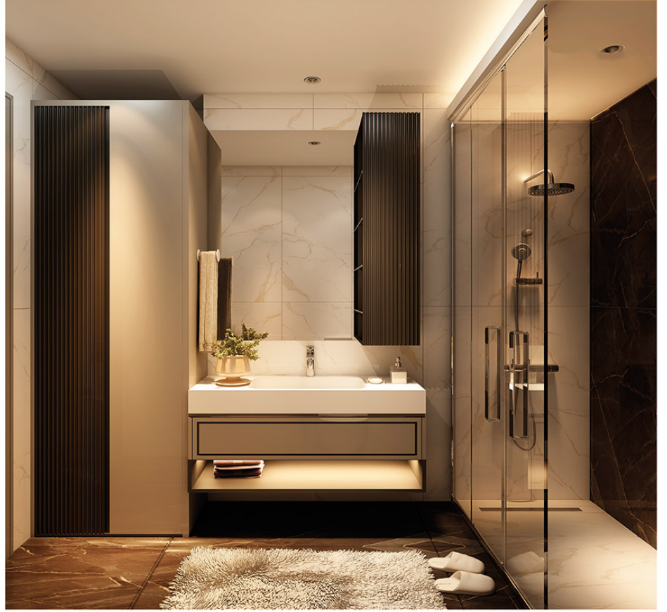
KNK YAZIR Konutları // Banyo - Lavabo