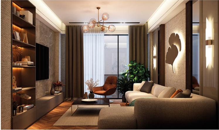
KNK YAZIR Konutları // 4+1 Oturma Odası