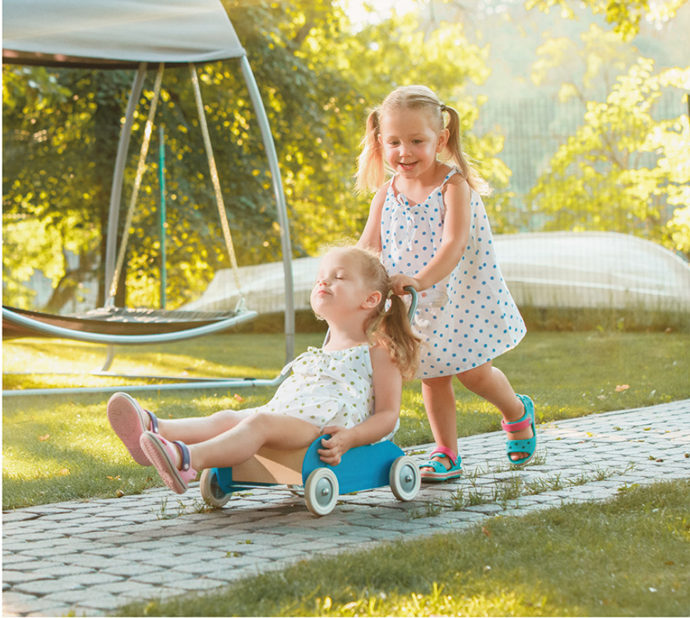
KNK YAZIR Konutları // Oyun Alanları - Bahçe

Çocuklara oyun ve eğlence alanları, büyüklere spor ve dinlenme alanları.