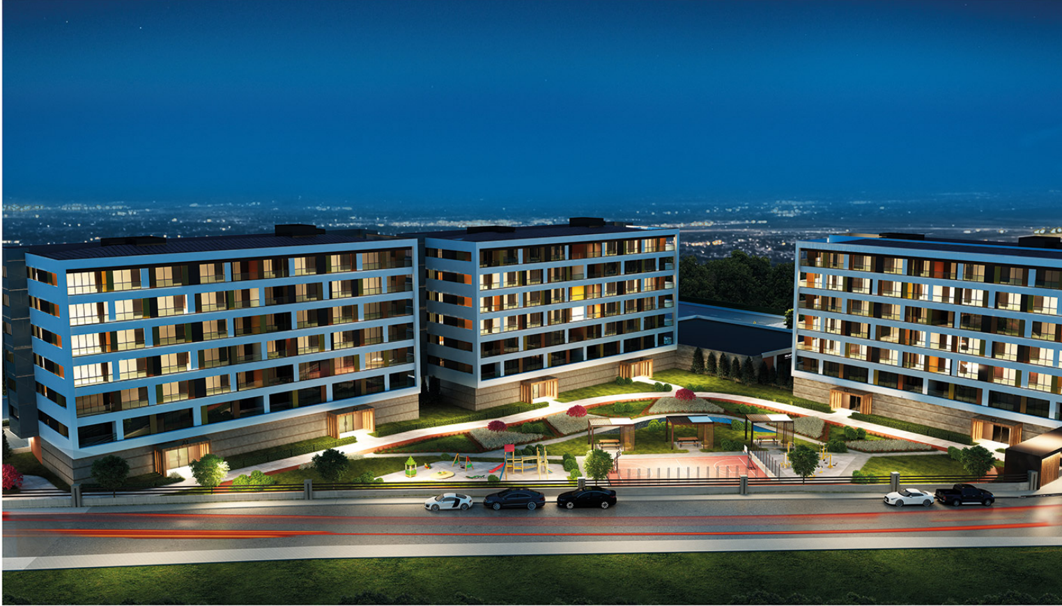
KNK YAZIR Konutları // Genel Görünüm